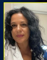
Grazia Casavecchia Ospedali Riuniti Foggia